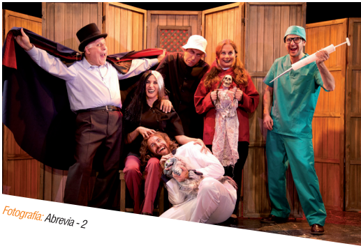
Fotografía: Abrevia - 2