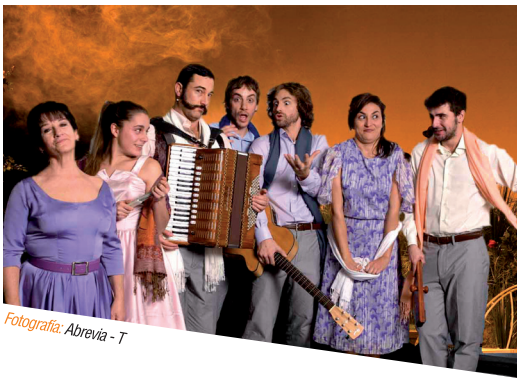
Fotografía: Abrevia - 1